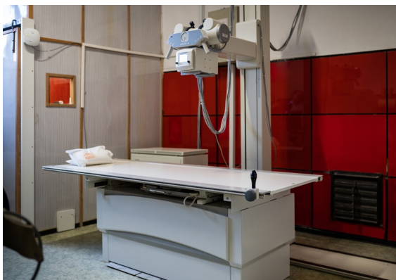
Az átadott PAUSCH gyártmányú motoros felvételi asztal